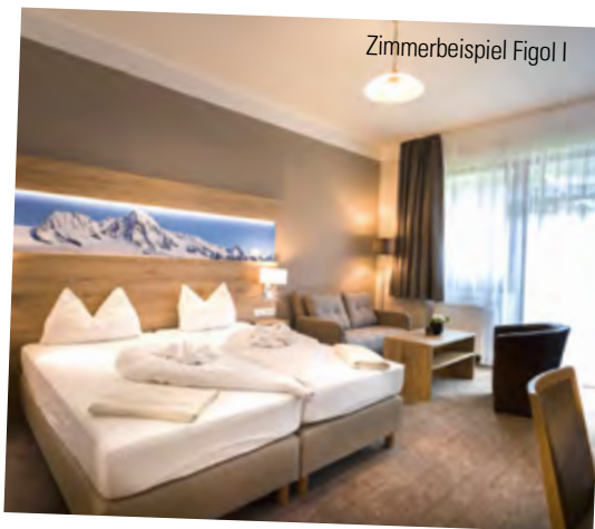
Zimmerbeispiel Figol I