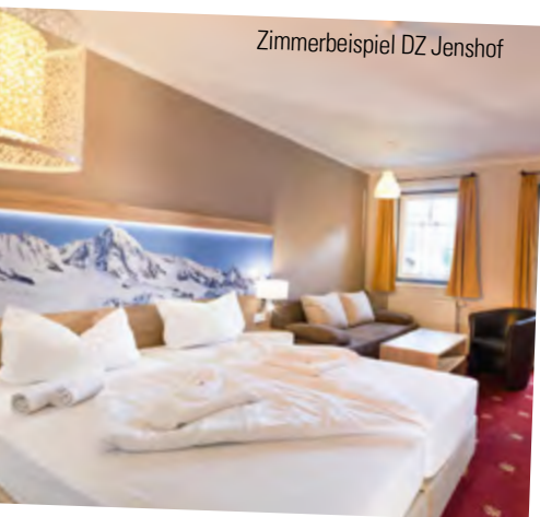
Zimmerbeispiel DZ Jenshof

für die Mahlzeiten, Gepäckaufbewahrungsräume für die An- und Abreisetage, beheizte Skistiefelhalter im Jenshof und Skischränke im Figol, eine Sonnenterrasse sowie das Après-Ski-Lokal „SCOL Stadl“. Am Morgen erwartet Sie ein umfangreiches Frühstücksbuffet, während des Tages ein Suppentopf im SCOL Stadl und täglich eine Nachmittagsjause. Besonders unsere Themenbuffets am Abend bieten für jeden Geschmack das Richtige. Übrigens: sollten Sie Allergien oder Lebensmittelunverträglichkeiten haben, sagen Sie uns einfach Bescheid, unsere Küche wird sich speziell darauf vorbereiten.