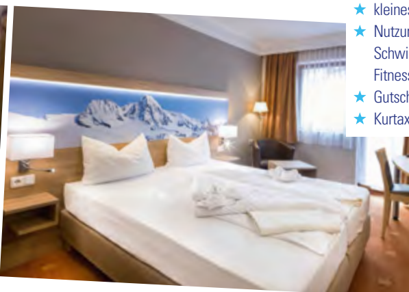
Zimmerbeispiel Figol II