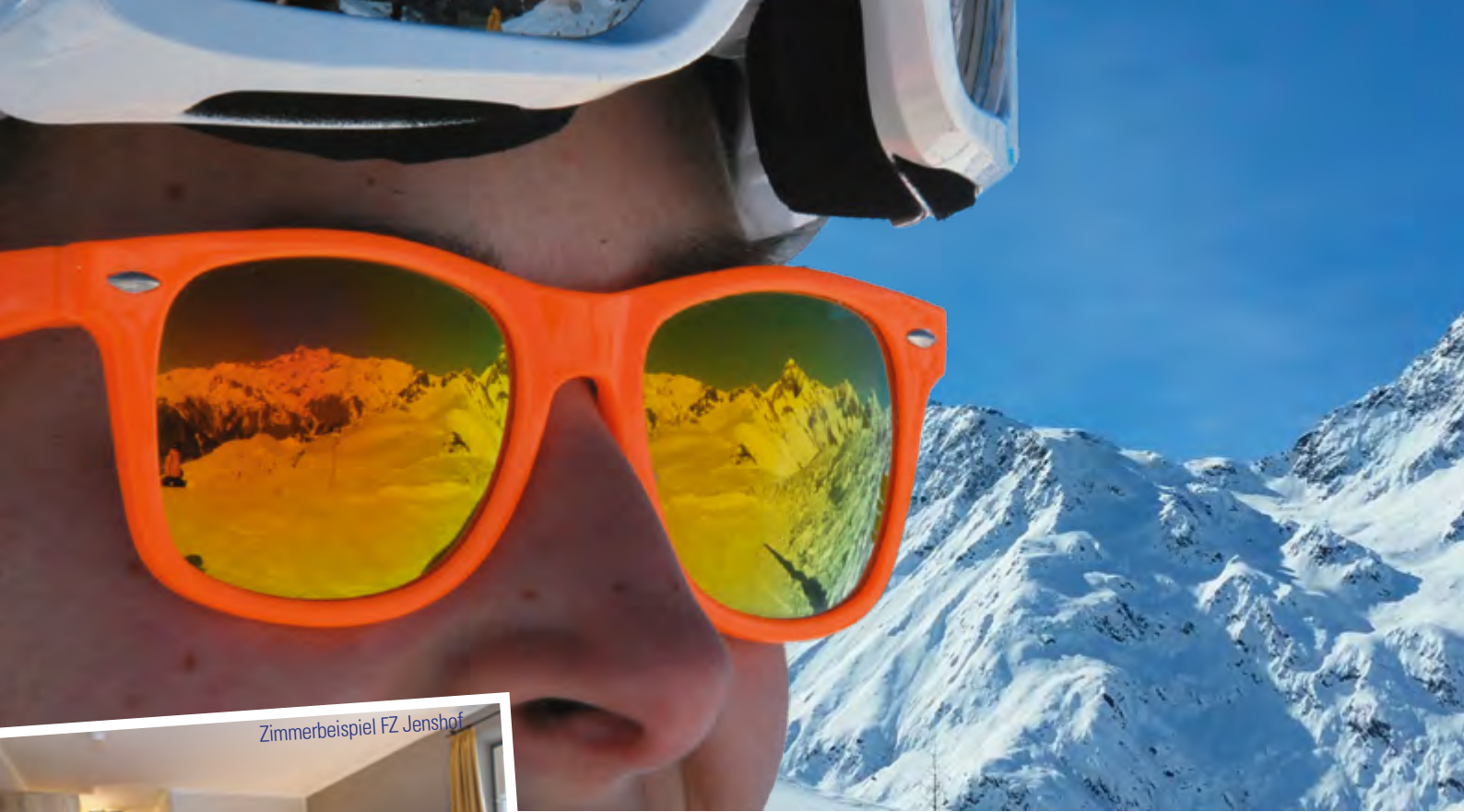
Zimmerbeispiel FZ Jenshof