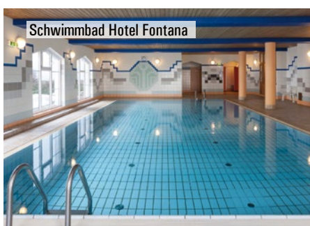
Schwimmbad Hotel Fontana