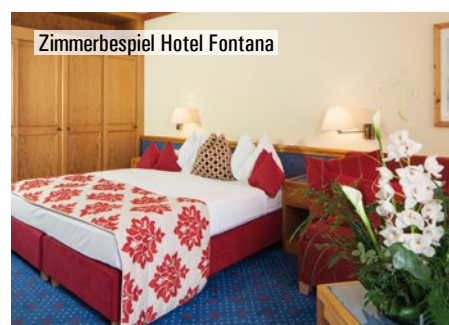
Zimmerbeispiel Hotel Fontana