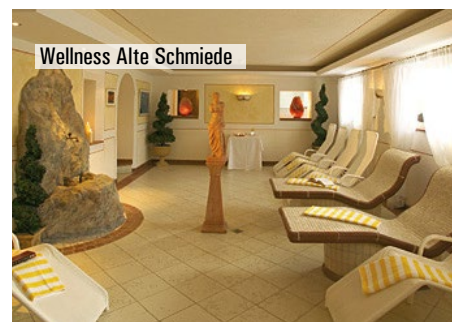
Wellness Alte Schmiede