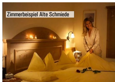
Zimmerbeispiel Alte Schmiede

Kat. A1: Das *** Hotel Tirolerhof liegt im Zentrum von Serfaus. Die Dorfbahnstation „Raika“ ist nur ca. 30 Meter entfernt. Das Hotel bietet einen integrierten Wohlfühlbereich: Entspannung und Wellness von Sauna über Dampfbad und Infrarotkabine bis zum Kneippbrunnell. Sehr gepflegte, komfortabel und gemütlich eingerichtete Zimmer mit Bad oder DU/WC, Telefon, TV, Safe und z.T. Balkon sorgen für den gewünschten Wohlfühlfaktor. Es stehen neben Doppelzimmern auch Familienzimmer und Suiten zur Verfügung. Die Familienzimmer bestehen aus einem Wohnschlafraum, das Zusatzbett ist optisch abgetrennt. Die Suiten bieten euch zwei getrennte